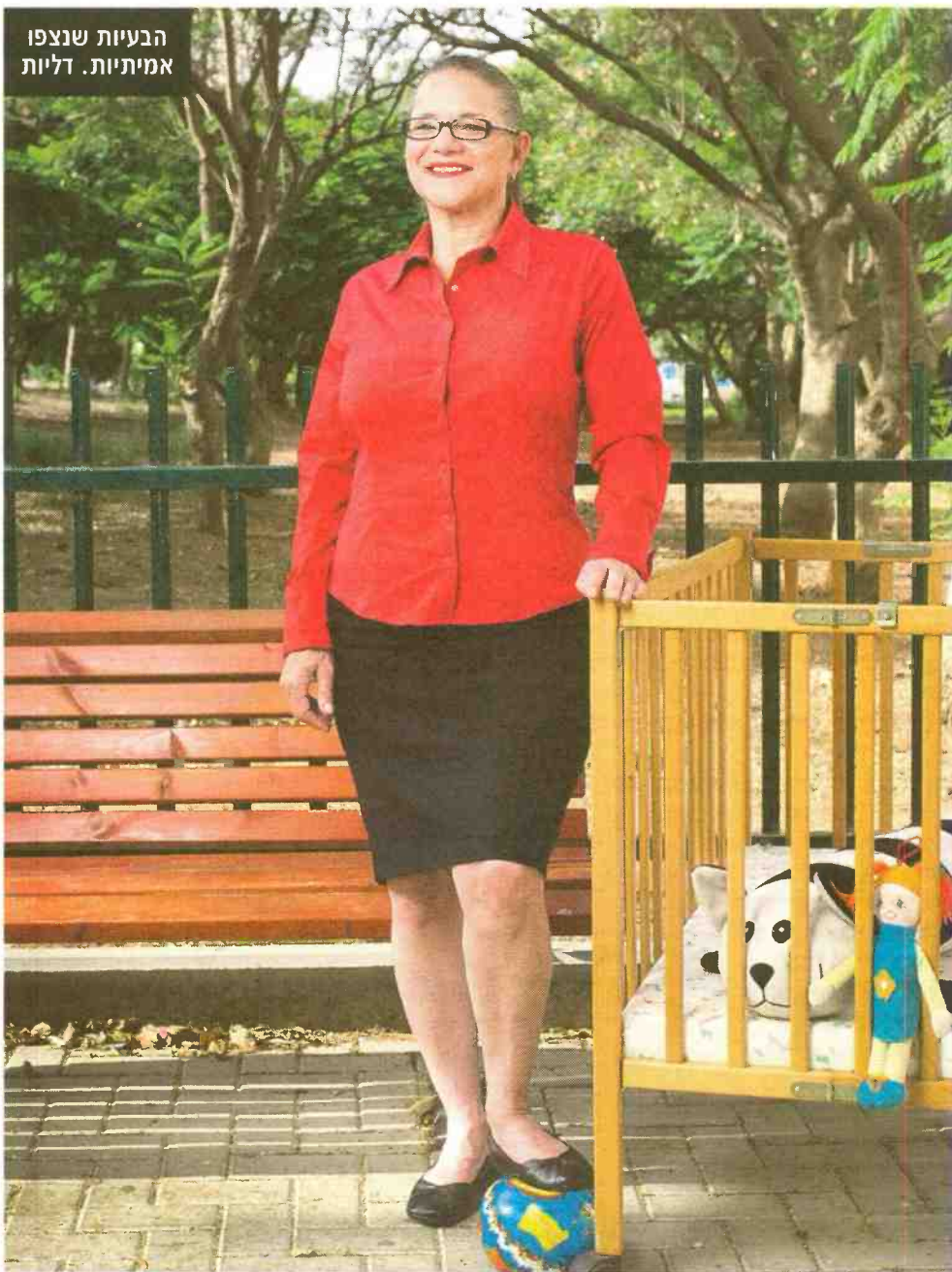
הבעיות שנצפו אמיתיות. דליות

מעובדות 'משפחה חורגת': "אחרי 35 אחוז רייטינג, הילד הולך לבית ספר, וכולם ראו אותו במקומות הכי מבישים שלו. צוחקים עליו. האווירה הכללית במערכת התוכנית הייתה: 'איזה מטומטמים הם שהם משתתפים'"